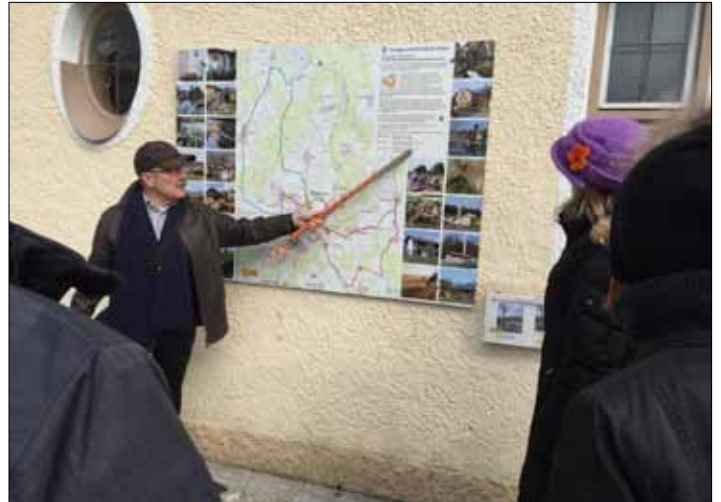
Informationstafel am Rathaus Glonn, Ausgangspunkt des Lehrpfades

formationen dazu finden Sie in der aktuellen Presse und im Internet. Auch die Informationstafeln an jeder Station bieten einen guten Einblick über die in Glonn praktizierten Maßnahmen zur Energieeinsparung und den Mix verschiedener regenerativer Energieformen.