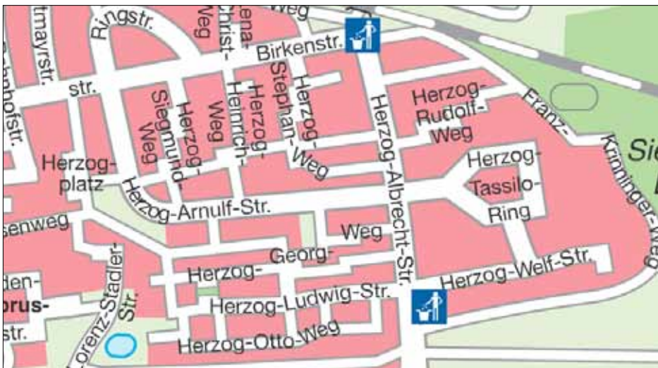
Auszug aus dem digitalen Ortsplan der Gemeinde