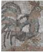
2. Auf dem Schulhof, Grundschule Zorneding