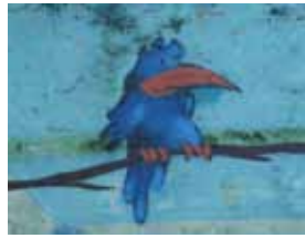
10. Halfpipe am Skaterpark Daxenberg Ost