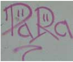
9. Traföhäuschen zwischen Lorenz-Stadler-Str. und Herzogplatz