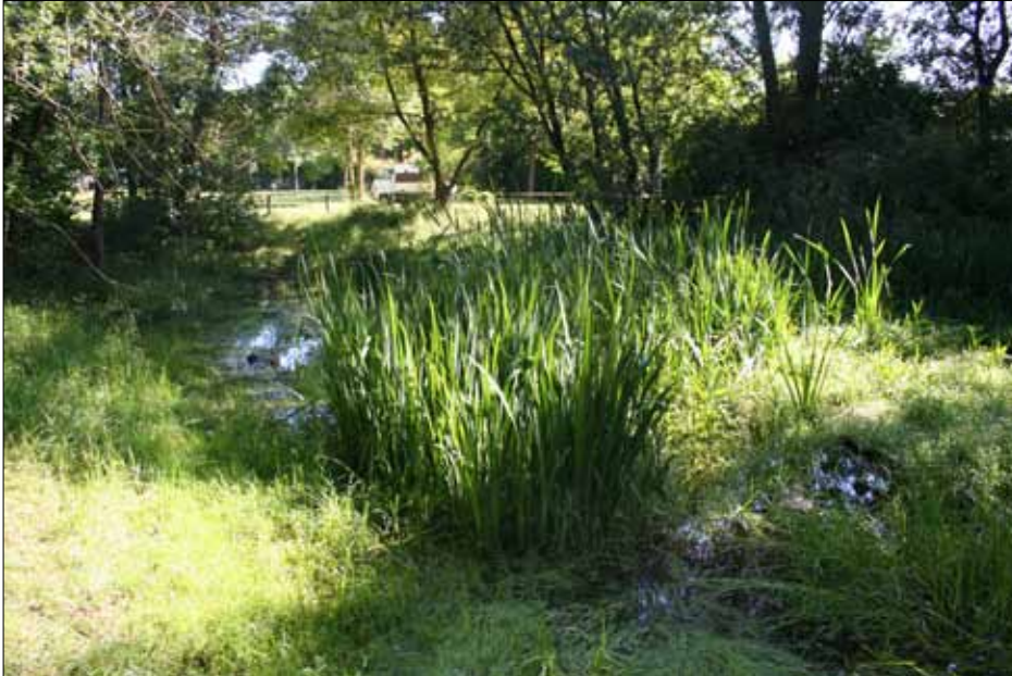
Die Thalhamer Lacke vor der Sanierung, weitgehend zugewachsen

Bereits im November 2013 wurde auf der Bürgerversammlung von einem Zornedinger Bürger der Wunsch vorgetragen das Biotop Thalhamer Lacke besser zu pflegen. Das Biotop liegt südlich des Her-