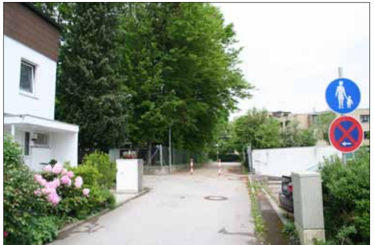
Ein erstes Ergebnis: Zwei Pfosten versperren den Fußweg am Ende der Herzog-Ludwig-Straße für Autos

Da die Wege – insbesondere am Kindergarten Pfarrr Paulöhr – von Kindern und Schülern auf dem Weg zur Grundschule genutzt werden, wurden in den 80er-Jah-