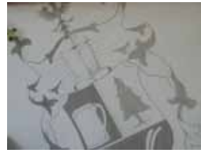
11. Biergarten Neuwirt, Münchnerstraße 4