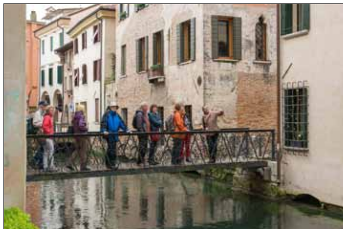
Altstadt von Treviso

Am Sonntag kam zunächst die gewohnte Tour zur Weinkellerei Barazza,