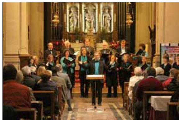
A cappella! in Santa Maria Maddalena