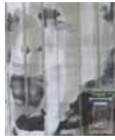
5. Stromkasten zwischen Ringstraße und Bahnhofstraße