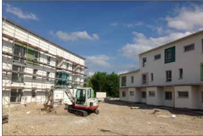
Hier baut die GWG 17 Wohnungen und 5 Reihenhäuser in Poing

Gemeinden einen Rücklauf, eine ernüchternde Reaktion. Das Ergebnis: in Ebersberg, Grafing und Poing stehen Grundstücke zur Verfügung, die für langfristige Planungen vorgesehen sind. Aus Glonn, Steinhöring, Bruck, Egming, Frauenneuharting und Pliening kamen Absagen. Aus