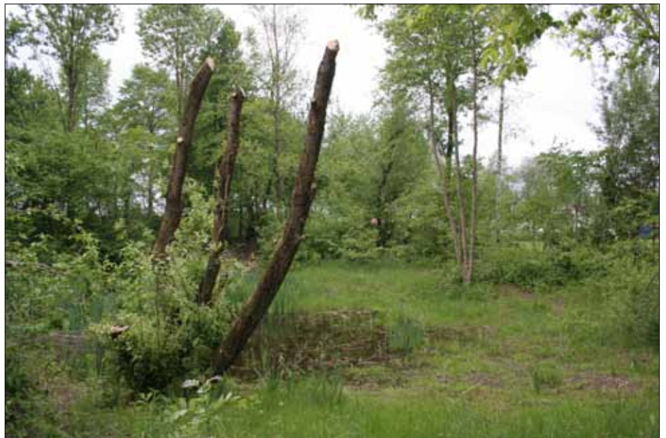
Hier wachsen jetzt Kopfweiden, aber die Natur muss sich erst noch erholen

Wegen der geltenden Naturschutzrichtlinien wurden die Arbeiten erst nach dem 1. Oktober 2014 ausgeführt. Die Veränderung des Gewässers war auf den ersten Blick erschreckend. Jetzt im Frühling