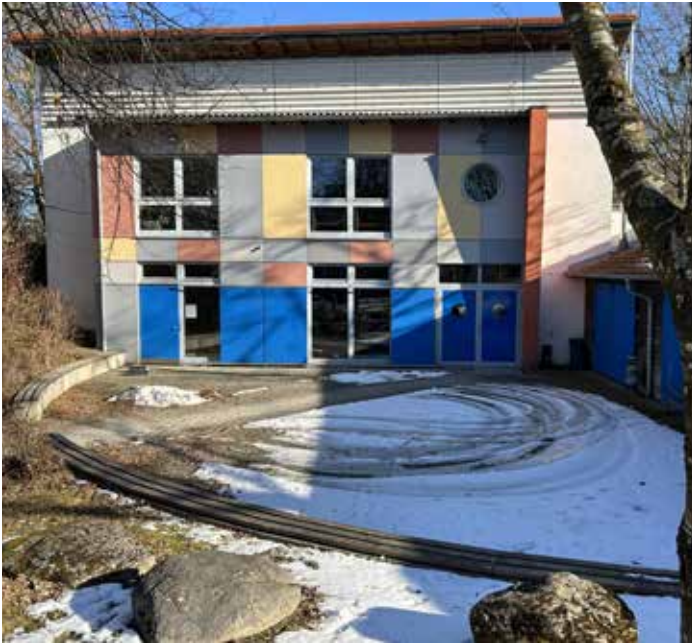
ziemlich verwaist: unser Jugendzentrum