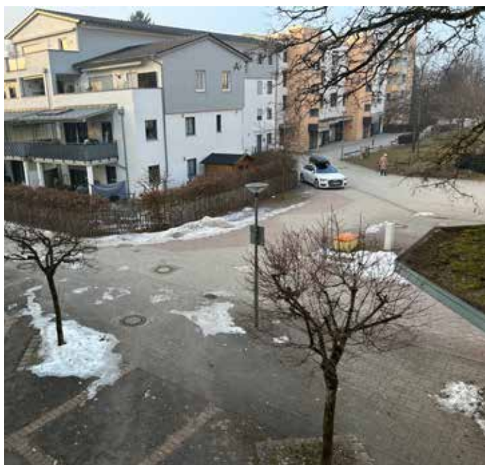
Herzogplatz: Tristesse soll verschwinden

Wir setzen uns dafür ein, vorhandene und zum Teil etwas verwaiste Plätze wieder zu beleben. Hier denken wir insbesondere an den Herzogplatz und das Pöringer Ortszentrum. Durch ein gutes Miteinander von Handel, Gastronomie und öffentlichem Leben wollen wir sie wieder attraktiv machen.