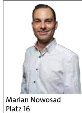
Marian Nowosad Platz 16