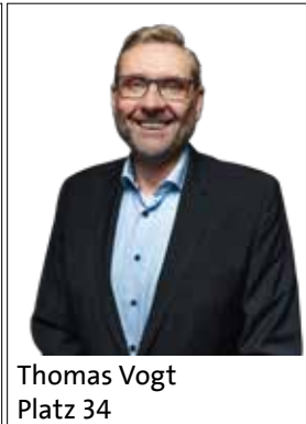
Thomas Vogt Platz 34