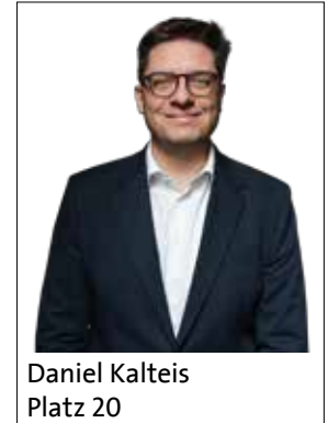
Daniel Kalteis Platz 20