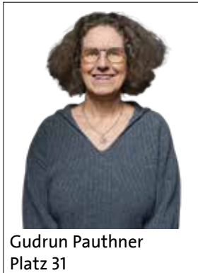
Gudrun Pauthner Platz 31