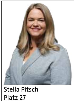
Stella Pitsch Platz 27