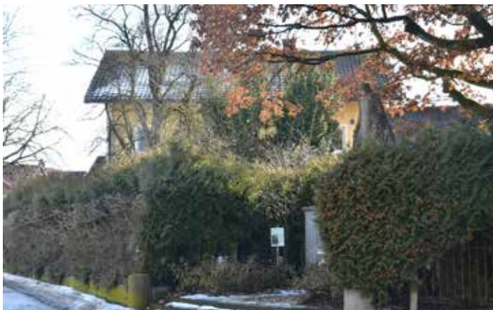
Ortsmitte neu denken!